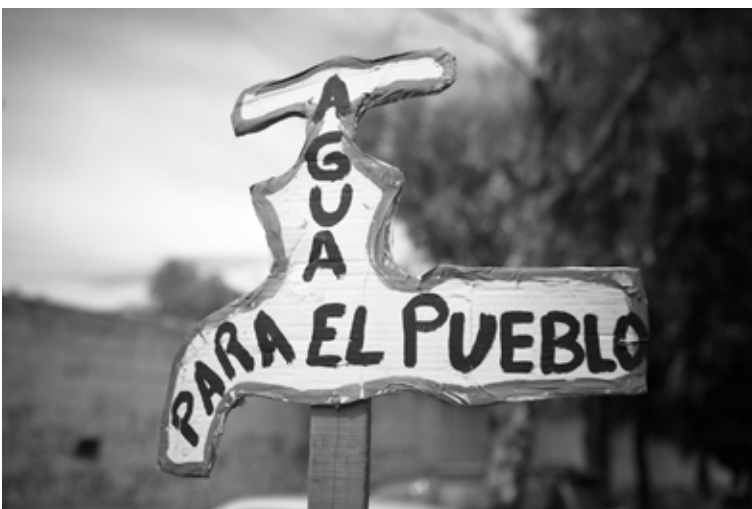
Feria internacional del agua, Cochabamba, avril 2010

D'autre part, l'entreprise, qui travaille encore à perte, n'a pas réellement réussi à rattraper le retard de raccordement de la zone Sud de la ville, ni à résoudre les problèmes de financement de l'investissement nécessaire pour entretenir son réseau vieillissant et augmenter le taux de raccordement. Des efforts ont toutefois été accomplis en ce sens, grâce à l'aide internationale (dont une partie a été mobilisée en réaction aux événements de 2000). D'autre part, l'entreprise a maintenu une politique de prix bas et a mis en place une grille tarifaire théoriquement favorable aux populations les plus défavorisées, car alignée sur la valeur foncière du logement de l'usager.