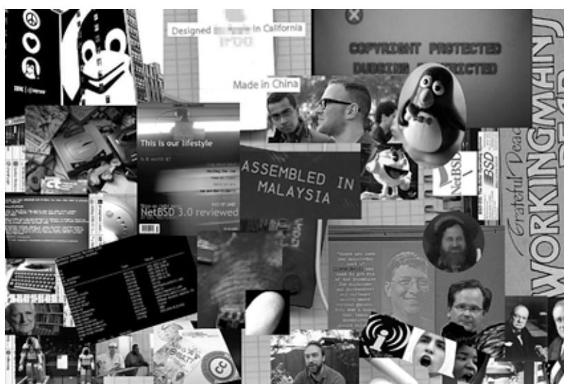
Informatics 2005/2006 Creative Commons photo-patchwork

La théorie des Communs connaît un nouveau regain depuis la fin des années 1990, quand on a commencé à considérer les connaissances, les informations et le réseau numérique internet lui-même comme un nouveau Commun, partagé par tous les usagers, et auprès duquel chaque usager a des droits (libre accès au savoir, neutralité de l'internet, production coopérative, à l'image de Wikipedia...) comme des devoirs. Il existe une différence majeure entre ces Communs de la connaissance et les Communs naturels, qui a été pointée par Elinor Ostrom : les biens numériques ne sont plus soustractibles. L'usage par l'un ne remet nullement en cause l'usage par l'autre, car la reproduction d'un bien numérique (un fichier de musique, un document sur le réseau, une page web...) a un coût marginal qui tend vers zéro. On pourrait en déduire que ces Communs sont « iné-