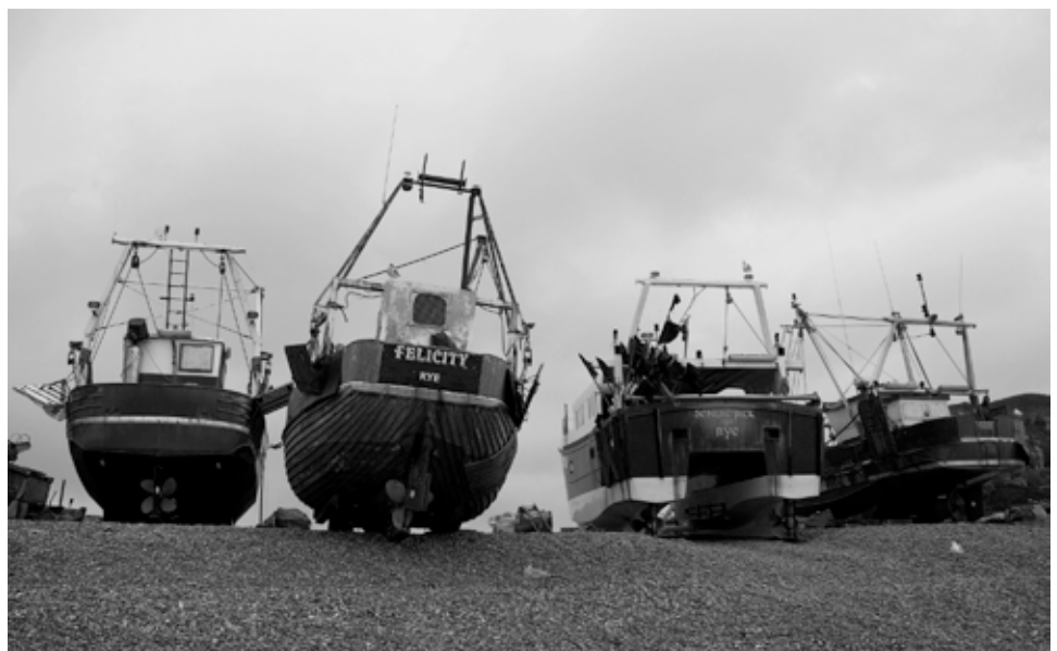
Hastings, Sussex, Royaume-Uni

Pour nous, il y a donc un préalable à toute réforme de la PCP (Politique commune des pêches), c'est la reconnaissance juridique des droits d'usage collectifs des pêcheurs, la reconnaissance de la priorité donnée aux fonctions de production alimentaire de la mer. Ces droits impliquent en contrepartie des devoirs et des responsabilités, de bonne gestion, de préservation de la qualité de l'environnement, de transparence et d'équité. C'est sur cette base que peut se mener la négociation sur le développement de nouvelles fonctions ou activités ou la mise en œuvre de restrictions. Les zones concernées sont bien sûr la bande littorale