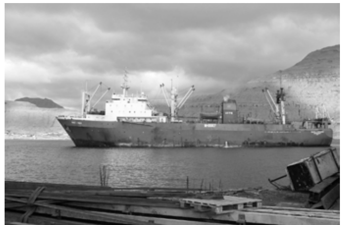
bateau de pêche industrielle russe dans les îles Féroé

La gestion par les captures (TAC et quotas) conduit inévitablement à l'accumulation de droits de pêche et des avantages entre les mains des gros opérateurs. Lorsque les TAC (taux autorisés de capture) ou QIT (quotas individuels transfé-