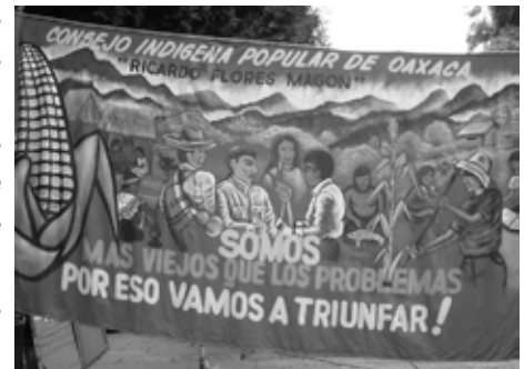
manifestation indigène, Oaxaca

L'idée de double conservation, naturelle et culturelle, est ici entière. Il s'agit d'attribuer aux communautés indigènes des droits spécifiques – ici, le droit d'administrer la communauté selon le système des us et coutumes, qui implique une rotation des charges - dans une double ambition : celle de renforcer ces communautés, et celle d'améliorer la gouvernance des ressources naturelles sur leurs territoires. En transférant vers le local des responsabilités en matière d'environnement, le gouvernement mexicain se désengage et revoit à la baisse sa force d'intervention, ce qui le conforte dans ses choix économiques et le modèle néolibéral qu'il a choisi. Parallèlement, il s'inscrit dans une démarche consensuelle de développement durable qui doit favoriser l'« empowerment » des plus populations les plus marginalisées et la protection de la diversité au sens large.