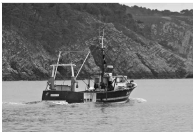
caseyeur, Finistère, France