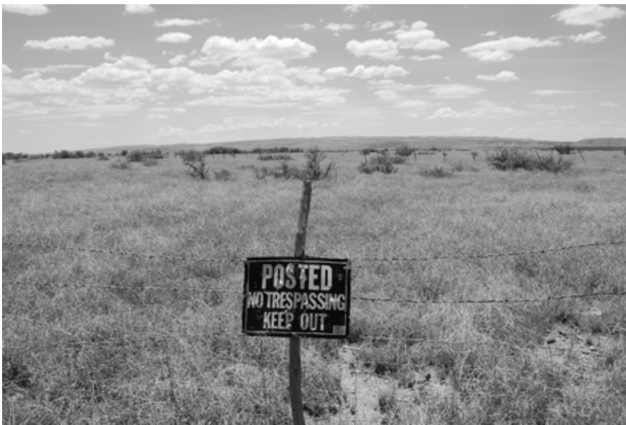
Texas, Etats-Unis

D'autres situations défavorables aux populations sont plus difficiles à appréhender. Quand les droits sur la terre ont été reconnus et formalisés par le biais de la remise de titres de propriété individuels mais qu'aucun mécanisme de régulation des marchés fonciers ni de contrôle social de l'évolution des structures agraires n'ont été mis en place, la propriété du sol est alors beaucoup plus absolue que celle qui prévaut dans les pays développés. Les transferts de terres se font par achat/vente sur la base du commun accord entre des parties disposant de moyens très inégaux, et nombre de producteurs perdent tout accès à la terre. C'est le cas en Argentine où les appropriations massives de terres par des étrangers et des entreprises ou des fonds nationaux passent par l'acquisition et non par le vol. Les pays qui avaient collectivisé leur agriculture, comme l'Ukraine et la Russie, ont vu leurs paysanneries détruites et privées de leurs droits sur la terre au profit d'instances collectives. Ils connaissent une situation différente dans laquelle la cession des droits se fait aussi formellement de façon volontaire entre les investisseurs, les structures héritées des anciennes exploitations collectives et les « actionnaires » de celles-ci. Ces derniers détiennent des droits individuels sur la terre, mais ils sont incapables de faire-valoir efficacement.