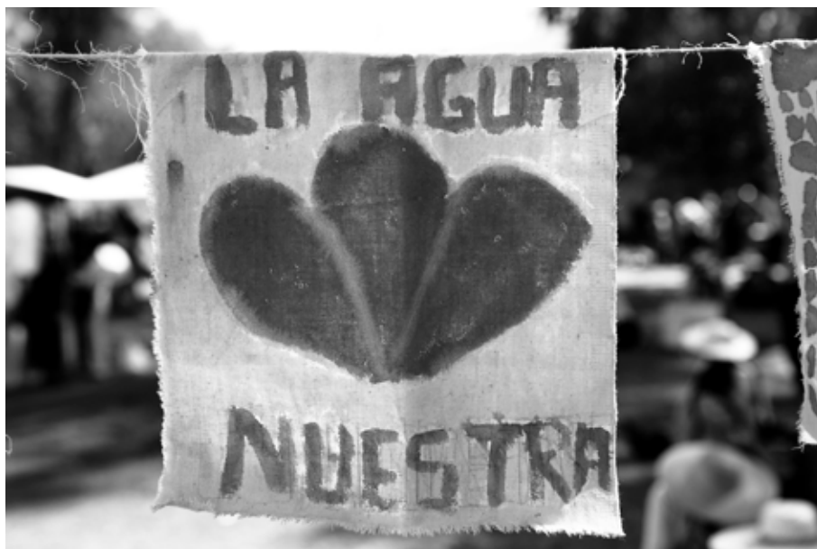
Feria internacional del agua, Cochabamba, avril 2010

DMAE et Public Services International (PSI). "Water in Porto Alegre, Brazil – accountable, effective, sustainable and democratic". www.psir.org/reports/2002-08-W-dmae.pdf