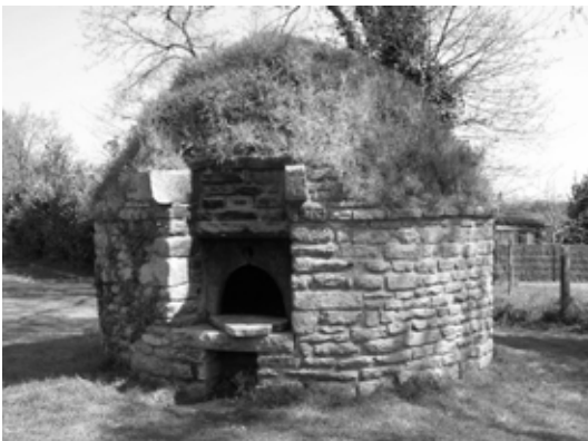
four à pain, Bretagne

Ensuite j'ai découvert les autres facettes de ces blés oubliés car inadaptés à l'agriculture intensive. Une formidable diversité de couleurs et de formes. Et tout l'univers de la boulange artisanale et paysanne qui a adopté ces blés pour un plaisir retrouvé au fournil. Pourquoi laisser ces beaux blés enfermés dans les conservatoires alors qu'ils donnent un meilleur pain, plus nutritif, qu'ils colorent les champs ? Pourquoi ne pas devenir acteur de la conservation de la biodiversité, comme avec les races animales ?