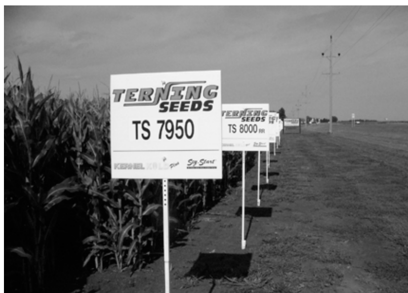
semences brevetées de maïs, Minnesota, États-Unis

C'est pourquoi de nombreux agriculteurs, bio ou non certifiés, mais voulant tous s'affranchir des engrais et des pesticides chimiques, se sont regroupés au sein du