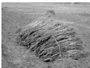
maca et ayahuasca