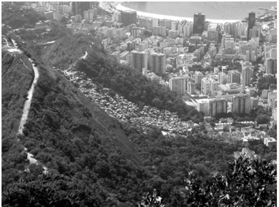
favela Dona Marta, Rio de Janeiro

Ce changement nécessaire des mentalités et des pratiques ra-