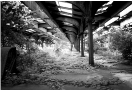
Jersey City Terminal, New York