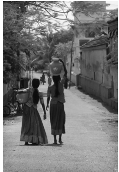
Tamil Nadu, Inde

Il faut tirer deux enseignements de cette expérience. Tout d'abord, considérer les communautés comme des partenaires de travail est la seule manière de préserver les ressources en eau pour les générations futures. Ensuite, l'eau doit rester entre les mains du secteur public et être traitée comme une ressource collective et non comme une marchandise. Une jeune villageoise l'a exprimé très joliment : « Pour nous, économiser l'eau est une question de survie, ce n'est pas comme pour un commerçant qui ferme sa boutique parce que son affaire n'est plus rentable. »