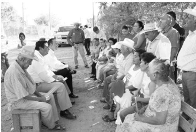
visite d'un candidat du PRI à un ejido

Mais le modèle de l' ejido n'a pas été exempt de défauts : ingérence importante des organismes de tutelles de l'État qui donnait à l' ejido un caractère hybride d'organe de gestion locale et de dépendance de l'État, différenciation interne souvent forte au sein de l' ejido , facilitée par l'organisation de sociétés de crédit qui ne bénéficiaient qu'à une minorité d' ejidatarios , apparition de caciques « ejidiaux ». Pour ces différentes raisons, les instances de contrôle social n'ont pas pu évoluer pour empêcher un certain immobilisme en matière d'accès au foncier, contourné là où il existait un fort potentiel économique par des arrangements en marge de la loi. Le parcellement des exploitations avec les divisions est devenu très important. En 1988, 49% des parcelles ejidales avaient moins de 5 ha.