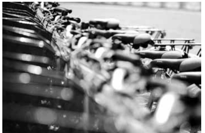
vélos partagés à Rome