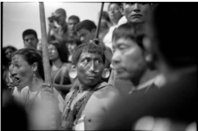
Forum social mondial 2009, Belém, Brésil

Le Forum social mondial a pour devise « Un autre monde est possible ». Là encore, il s'agit d'une phrase d'un poète français, surréaliste et communiste, Paul Éluard. N'oublions pas le vers qui suit cette devise : « Un autre monde est possible/ Mais il est dans celui-ci ».