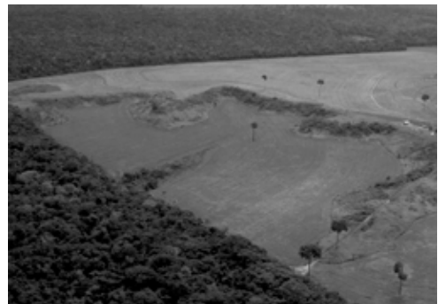
Mato Grosso, Brésil

Tout au plus pourrait-on dire que le sous-sol de la Demi-Lune appartient aux Guarani en vertu de la convention 169 de l'OIT, mais ni celle-ci, ni même les articles 15 et 8-j de la Convention sur la Biodiversité ne leur en réservent l'accès et la jouissance exclusive. L'État en est le « gardien » ( custodian ) et doit veiller à obtenir l'assentiment préalablement éclairé de la communauté locale s'il en accorde l'accès, en partageant avec elle les bénéfices. C'est ce qu'on appelle aujourd'hui un « régime d'ABS » ( Access & Benefit Sharing ). À partir du moment où l'État existe comme appareil de redistribution, il est normal que les revenus résultant de l'exploitation d'une ressource commune locale soient redistribués à l'échelle nationale. De la même façon, d'ailleurs, il est normal que l'État et la communauté internationale prennent en charge une partie du fardeau que représente la « charge » d'entretenir localement un bien commun d'intérêt global.