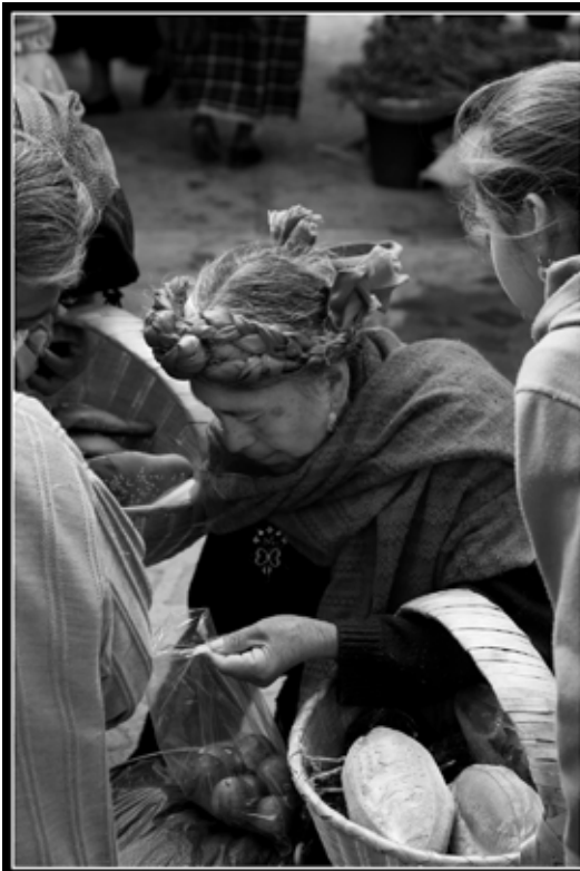
marché de Teotitlán del Valle, Oaxaca