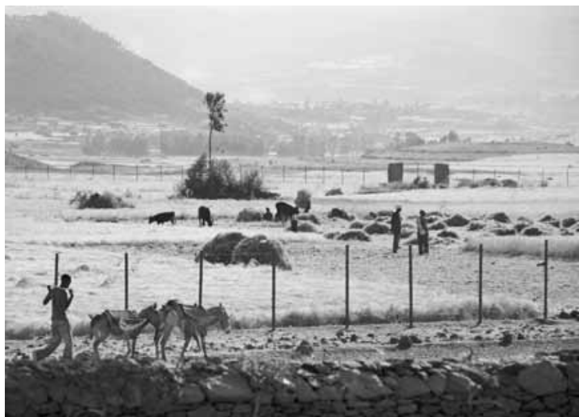
région d'Axum, Ethiopie

Les institutions internationales et de coopération bilatérale qui travaillent dans le domaine agricole, les organisations de défense des droits humains et les associations de producteurs se sont emparées du sujet. La Banque Mondiale parle d'acquisitions de terres, la Coalition Internationale pour l'Accès à la Terre de pressions commerciales sur les terres, les acteurs de la coopération française sur le foncier d'appropriation à grande échelle, les ONG et organisations paysannes d'accapement. Ces mots ne sont pas neutres ; ils reflètent chacun une partie de la réalité et les débats restent confus.