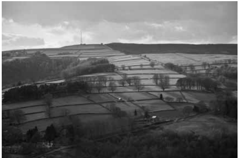
Derbyshire, Royaume-Uni

Du côté scientifique, la notion de Communs reçut une attaque particulièrement pernicieuse en 1968, quand le socio-biologiste Garrett Hardin publia son article « La tragédie des communs ». Dans ce modèle abstrait, Hardin considérait l'usage abusif de pâturages communs par des bergers, chacun cherchant à y nourrir le plus grand nombre d'animaux... au point de réduire la quantité d'herbe disponible. Ce modèle du « passager clandestin », qui profite d'un bien disponible sans s'acquitter de devoirs envers la communauté, reste le modèle abstrait de référence ; un modèle simpliste qui colle parfaitement avec l'idéologie libérale. Avec de telles prémisses, la conclusion de Hardin s'imposait :