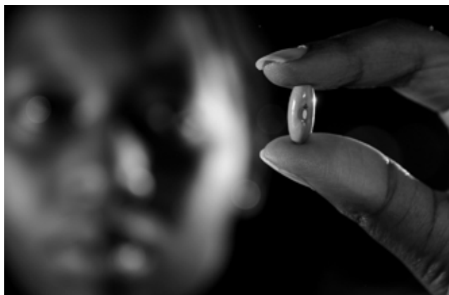
la variété «enola» de haricot, au centre d'un procès en biopiraterie

prônait un règlement bilatéral, sous la responsabilité directe des États concernés, du commerce des ressources génétiques. On peut penser que ce retour proposé au multilatéralisme traduit la difficulté des pays du Sud à définir des législations d'accès à la fois réalistes au regard des règles du commerce international et conformes à leurs intérêts.