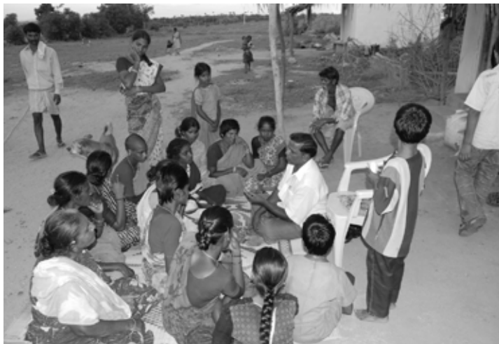
distribution de semences en Inde

Parmi les diverses méthodes adoptées par la Green Foundation, la conservation in situ implique la distribution contrôlée de diverses semences aux paysans en utilisant des cartes qui sont collectées après la saison. Le registre des banques de semences, les cartes de contrôle et la liste des paysans font partie de l'activité de conservation. Le paysan est encouragé à mettre de côté une partie de son approvisionnement en semences pour le semis, les échanges entre paysans et la vente sur le marché.