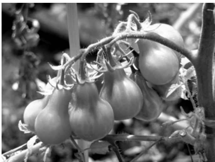
Jardin partagé, Paris (photo gelinh, cc-by-nc-sa)

Les biens qui se multiplient en se partageant existent de toute éternité : les relations familiales, les liens au sein de la communauté, la circulation des connaissances et de l'expérience par exemple. Leur gestion, évidemment