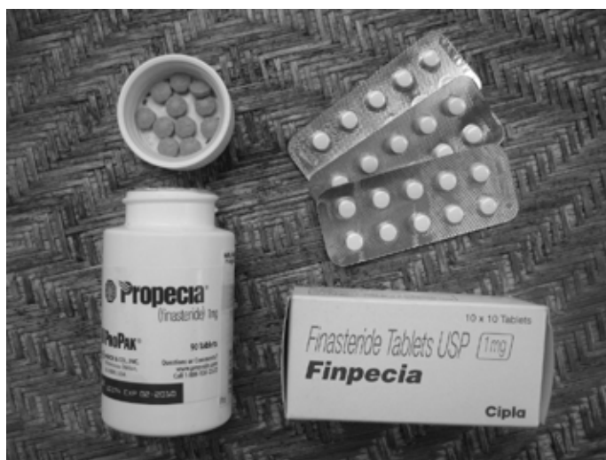
version US et version indienne

Les États-Unis ne sont pas les seuls à imposer un durcissement des réglementations en matière de protection de la propriété intellectuelle. L'accord récemment