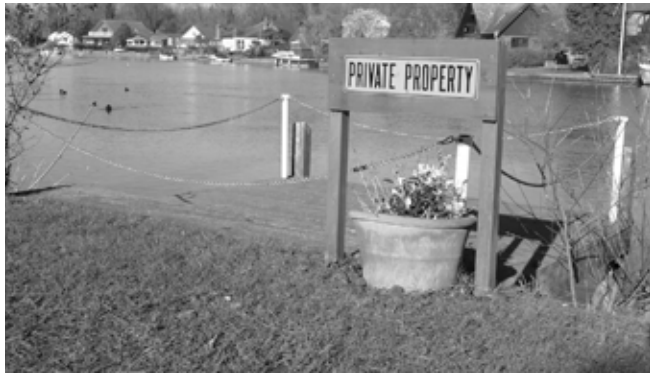
au bord de la Tamise, Royaume-Uni

grandes questions mondiales, de nombreuses ressources de la planète étant perçues de plus en plus comme bien commun, et «patrimoine» de l'humanité.