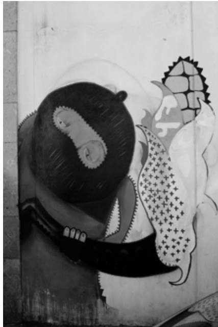
Oaxaca, Mexique