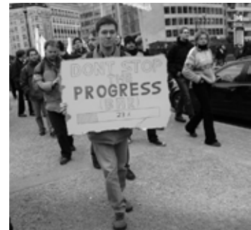
Manifestation contre les brevets sur les logiciels, Bruxelles