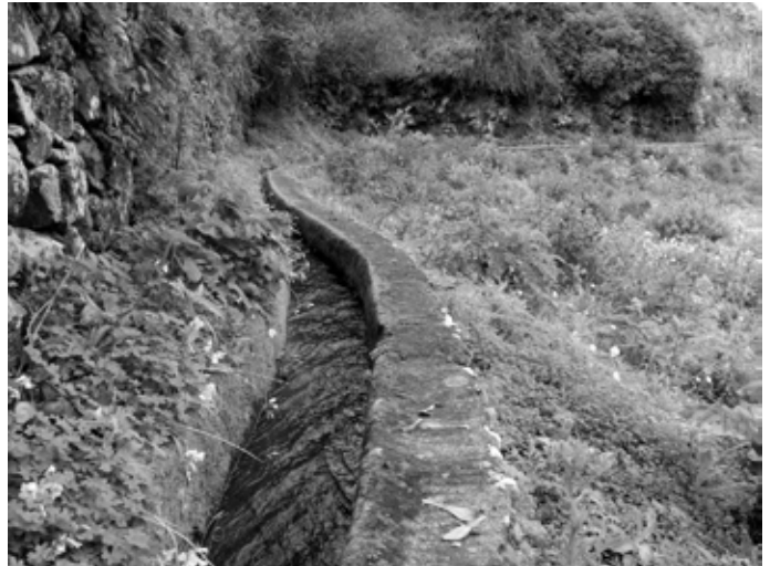
acequia, îles Canaries