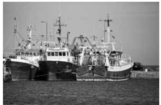
Howth, Irlande (photo informatique, cc-by-sa)

L'on a compris que la ressource marine présente au large, qui était le plus souvent exploitée par la pêche industrielle, dépendait de l'état de nos rivages, souvent entretenus par les pêcheurs artisans, et que par conséquent l'ancien cli-vage « sectoriel » ne reposait pas sur des stocks indépendants. L'on a compris également l'intérêt stratégique à réduire la pollution venant de la terre, voire de l'air pour des zones à forte pollution atmosphérique, puisque celle-ci appauvrit la diversité planctonique et par suite nos sources futures d'approvisionnement halieutique. Une grande vigilance est donc apportée aux rejets et écoulements des bassins versants, aux rejets atmosphériques qui, par le jeu des vagues, se retrouvent dans nos eaux, à l'impact des différentes activités maritimes dont le transport, les extractions... Les milieux lagunaires et littoraux, source d'une richesse extrême, font l'objet d'une attention soutenue. Compte tenu de l'engouement pour la pêche de loisirs et la chasse sous-marine, ces activités sont strictement limitées (plafonnement des captures par pêcheur, restriction des engins utilisés, interdiction de moyen de relevage mécanique pour la pêche de loisirs...). Tout le monde est surpris de la productivité naturelle des zones côtières depuis qu'elles sont restaurées et bien gérées.