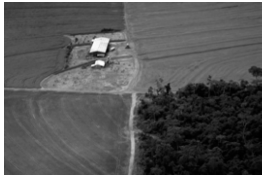
Soja et forêt, Mato Grosso, Brésil

Il existe au niveau mondial des systèmes d'administration des droits fonciers très diversifiés, qui sont liés à des processus historiques spécifiques. Suivant les ensembles culturels, selon les époques, les modalités d'héritage, des mécanismes de redistribution périodique de la terre et des richesses, l'existence de droits multiples, etc. ... ont donné lieu à des systèmes d'administration et de gestion du foncier plus ou moins centralisés et dont les fondements ne sont pas identiques. Ces différences se retrouvent aussi au cœur même des pays développés et ne correspondent aucunement à une démarcation entre sociétés développées et sous-développées, ou entre modernité et archaïsme. Ainsi, en Europe, il existe plusieurs systèmes de publicité foncière, de Registres de la propriété qui peuvent coexister sans que cela pose de problème insoluble 6 .