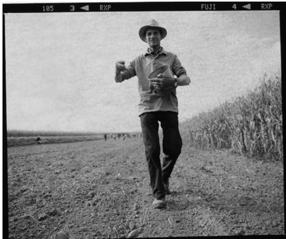
fête des semailles, Erstein, France

Pour faciliter la gestion et la diffusion de ces blés – et autres plantes cultivées de sélection paysannes et participatives – germent et s'enracinent des associations locales et des maisons de la semence : lieux d'échanges de savoir-faire et de semences, lieux collectifs de conservation et de triage de la semence, outils de recherche et de sélection participative décentralisée.