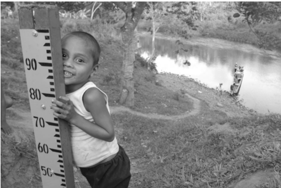
Miskitos, Nicaragua

Au cours d'un troisième atelier, les explorateurs agrégèrent leurs cartes sous la supervision de l'équipe de Herlihy, afin d'obtenir une carte finale révisée à l'échelle 1/250 000e. Cette carte maîtresse sert de base aux présentations publiques faites à Panamá et Tegucigalpa.