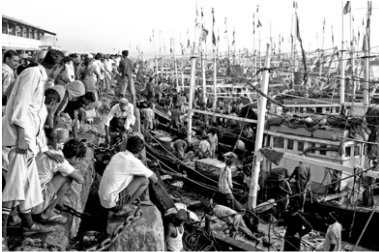
Mumbai, Inde

Elinor Ostrom a récemment obtenu le prix Nobel d'économie pour avoir montré que bien que la gouvernance des ressources océaniques soit défailante, de nombreuses pêcheries côtières ont été très bien gérées par les communautés locales qui contrôlent l'accès, les droits et les moyens de pêche, etc. Souvent, elles font mieux que l'État ou les systèmes privatisés.