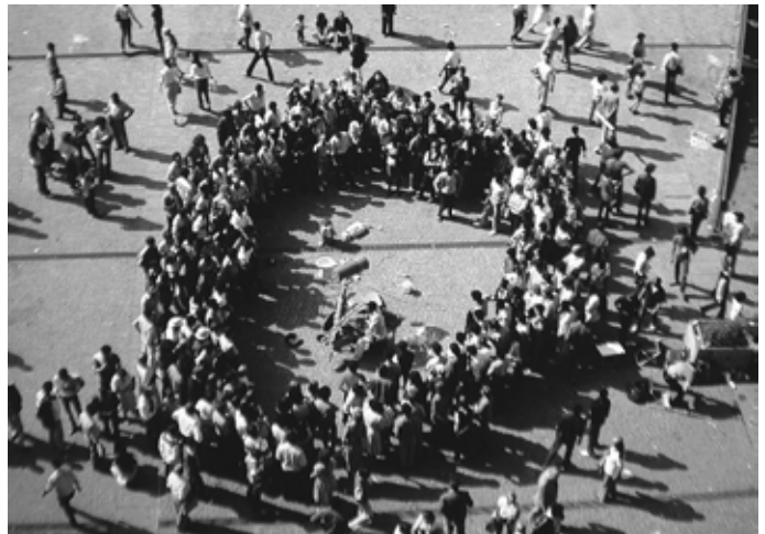
piazza du Centre Pompidou, Paris

La ville en tant que bien commun et en tant que territoire unique, en tant que site naturel en symbiose avec les constructions humaines au fil des générations, est le fondement d'une nouvelle économie et d'un nouveau pouvoir localisés, qui permettront de construire les bases du bien-vivre, démocratiques et durables.