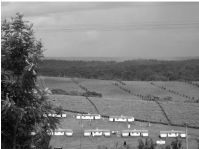
plantation de thé, Kenya

préférable à un achat formel. Il soulève moins de réactions négatives et peut s'accompagner de conditions financières favorables, un engagement plus ou moins vague à construire des infrastructures pouvant suffire, comme cela était le cas avec la tentative avortée de prise de contrôle de 1,3 million d'hectares par l'entreprise Daewoo à Madagascar. Le plus souvent, les contrats entre investisseurs et États hôtes prévoient une défiscalisation partielle ou totale des activités et des biens de l'entreprise. La combinaison de tous ces facteurs offre l'opportunité d'obtenir des profits élevés.