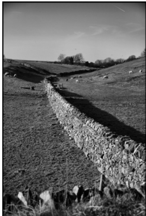
Derbyshire, Royaume-Uni

Un mot d'abord de son caractère féodal. Si les paysans (serfs ou libres) possèdent des terres en commun, outre la glèbe à laquelle ils sont attachés et les terres du seigneur sur lesquelles ils doivent effectuer des corvées, cette possession ne les empêche pas d'avoir à en partager le fruit avec leur seigneur sous forme d'impôt (la « taille »). Le rapport social de « commun » est articulé, surdéterminé et dominé par le rapport féodal. Une organisation sociale comme le féodalisme, tout comme le capitalisme, ne se réduit jamais à un seul rapport, il est une articulation de rapports sociaux dont certains peuvent nous paraître plus « progressistes » que d'autres, tout en restant auxiliaires d'une forme de domination.