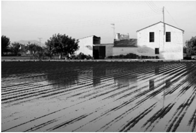
champ fraîchement irrigué, région de Valence, Espagne