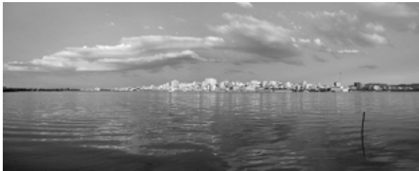
Porto Alegre vue du Lago Guaíba, principale source d'eau de la ville

décidés les années précédentes. Ces réunions sont aussi plus généralement une occasion pour le personnel du DMAE d'écouter les critiques et suggestions des habitants.