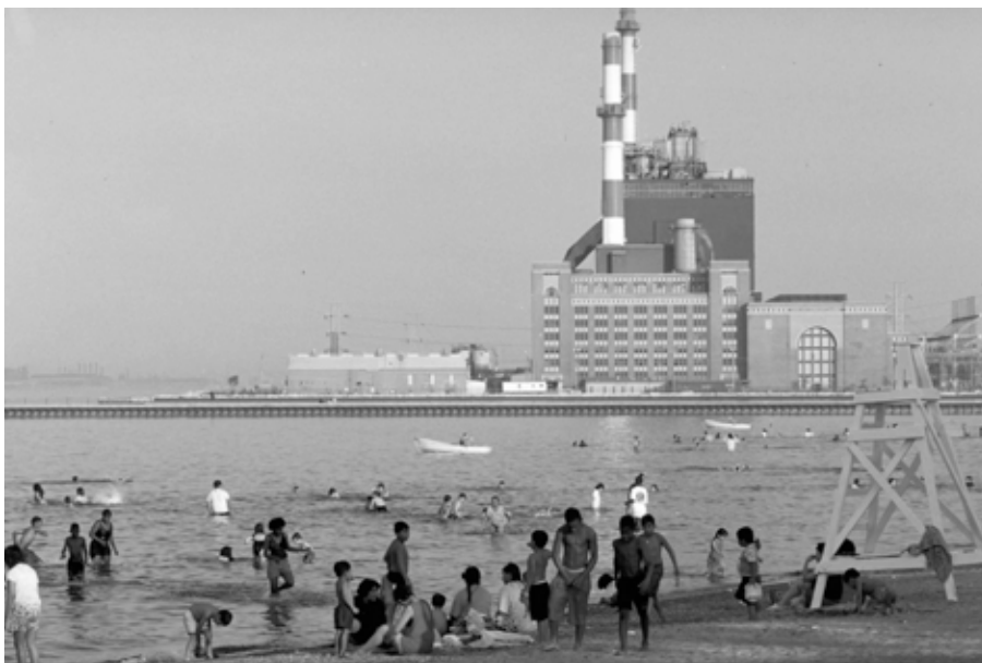
Calumet Park, Illinois, Etats-Unis

et à la croissance du PIB – s'est créée laborieusement, en quelques siècles de l'histoire humaine récente. Conquête et colonisation, avec la mise en esclavage de peuples entiers ; révolution industrielle et mode de vie basé sur un productivisme et un consumérisme sans limites ; impérialismes et guerres, changeant d'acteurs et de territoires, se sont succédé selon les nécessités, afin de garantir la domination de cette civilisation, jusqu'à nos jours. La globalisation capitaliste de ces dernières décennies est devenue l'horizon de quasiment toute l'humanité.