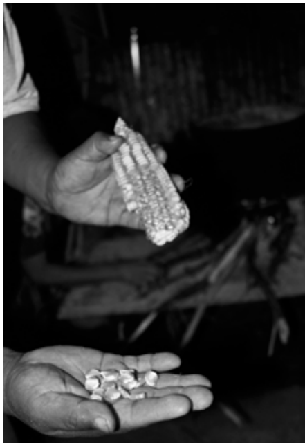
maïs indigène, Oaxaca, Mexique

pourquoi les États ont organisé la collecte de ces semences avant qu'elles ne disparaissent. En 1983, la FAO déclare que les « ressources phytogénétiques sont un patrimoine commun de l'humanité et doivent être préservées et librement accessibles pour être utilisées dans l'intérêt des générations présentes et futures ». Les semences paysannes de tous les champs du monde deviennent ainsi une ressource librement accessible pour l'industrie. En devenant monnayable sur le marché de l'humanité, autrement appelé marché mondial, ce patrimoine devient aliénable. D'un côté, les semences issues du travail et des savoirs paysans sont décrétées communes à tous, mais non commercialisables lorsqu'il y a un catalogue ou une certification obligatoire, de l'autre leur exploitation commerciale en fait des biens marchands privatisés par l'industrie semencière grâce aux droits de propriété intellectuelle.