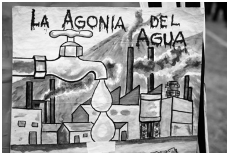
Feria internacional del agua, Cochabamba, avril 2010

À partir de l'été 2000, la Coordinadora , qui ne souhaitait pas revenir à la forme de gestion antérieure mais entendait promouvoir un contrôle et une gestion démocratique du service de l'eau, organisa des débats publics pour décider de l'avenir de la SEMAPA. Des négociations s'ensuivirent entre la Coordinadora , la municipalité de Cochabamba, le syndicat professionnel et les salariés de l'entreprise. Un comité de gestion provisoire de cinq membres fut mis en place, dont deux issus de la Coordinadora , deux représentant les intérêts du maire, et un ceux du syndicat. La collaboration entre ces trois pôles fut souvent délicate. Syndicats et représentants gouvernementaux bloquèrent les projets de la Coordinadora de mettre en place une gestion participative et un contrôle citoyen, tout comme d'autonomiser financièrement et opérationnellement la SEMAPA par rapport à la municipalité. Aujourd'hui, le contrôle politique direct du maire est encore une réalité. Signe de cette influence préservée, le débat sur le véritable intérêt du barrage du Misicuni n'a pas pu avoir lieu.